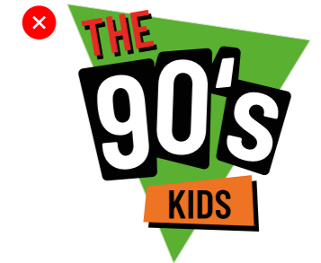
KLEUREN NIET VERANDEREN