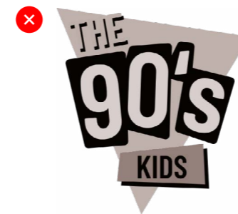
NIET IN GRIJSWAARDEN