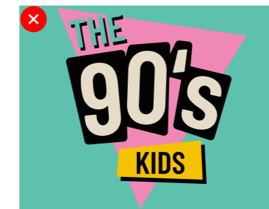
NIET TE WEINIG RUIMTE GEVEN